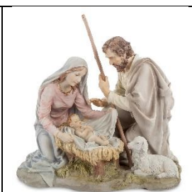
Б) Рождество Христово